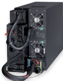
Eaton 9PX 11kVA mit Wartungsbypass

Die 9SX ist eine Energy Star® qualifizierte USV